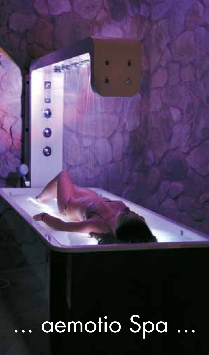
... aemotio Spa ...