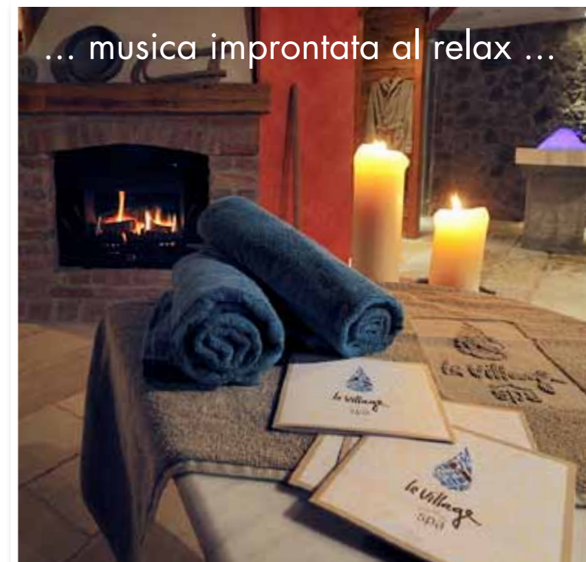
... musica improntata al relax ...

Sorseggiando una tisana consigliata dalle nostre terapisti, potrete rilassarvi su comodi e morbidi lettini, sotto un vecchio porticato in legno e pietra. Anche qui le tonalità dominanti sono l'azzurro e il marrone, la musica è improntata alla quiete, gli aromi avvolgenti. A fare da sfondo un caminetto che diffonde in tutta l'area una luce calda ed attraente unita al piacevole gioco del fuoco.