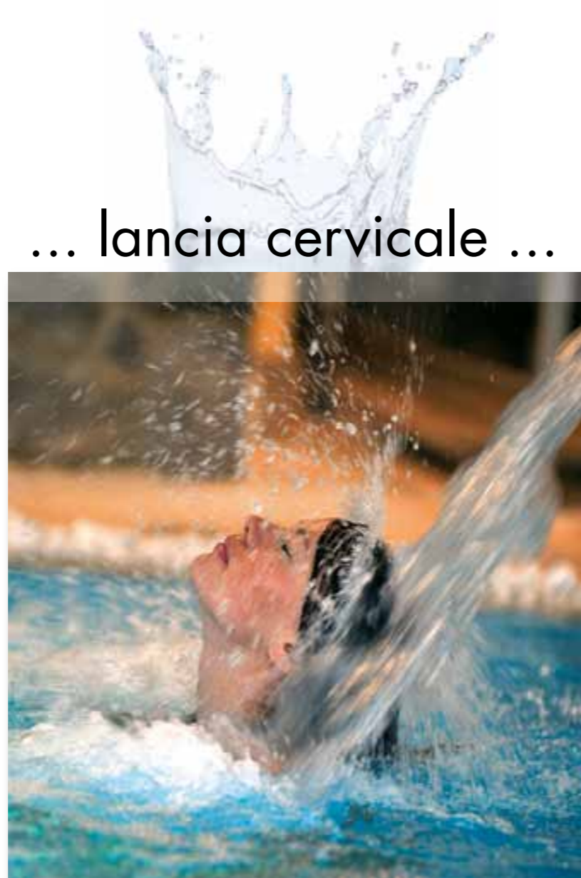
... lancia cervicale ...