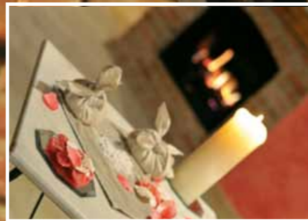
Aria, acqua, terra, fuoco: i quattro elementi si fondono in un'armonia assoluta